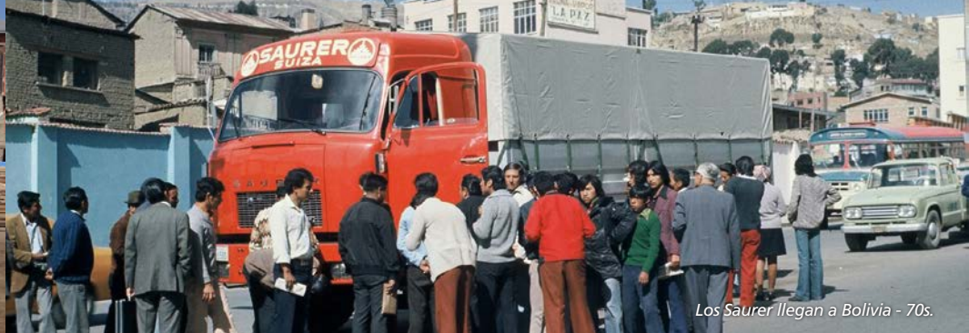
Los Saurer llegan a Bolivia - 70s.