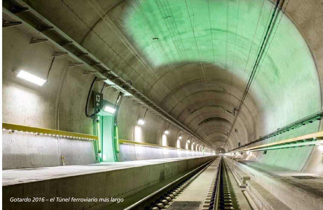
Gotardo 2016 – el Túnel ferroviario más largo