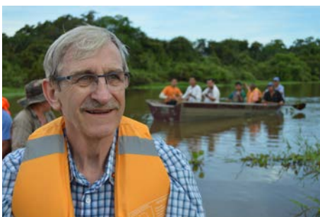
Peter Bischof Embajador de Suiza en Bolivia

Llevaré grabado en el corazón cada pequeño pueblo en el que de la manera más natural del mundo me recibieron con sentidas ceremonias en las que se baila con alegría, se comparte la comida, se muestra la cultura, se agradece y – sólo luego de todo ello - se trabaja. Ustedes saben, en otros lugares del