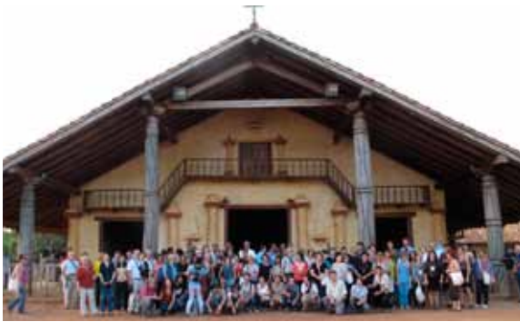
Algunos participantes de las XIV Jornadas Internacionales sobre las Misiones Jesuíticas en frente del templo de Santa Ana de Velasco, restaurado por la Cooperación Suiza (Cosude) y Española (Aecid) bajo dirección del arquitecto suizo Hans Roth.

Las antiguas misiones jesuíticas de Chiquitos en el Departamento de Santa Cruz han sido declaradas por la UNESCO en 1990 como Patrimonio Cultural de la Humanidad. Desde entonces, el interés por la historia, la arquitectura, la música barroca y las tradiciones vivas de estas misiones sigue creciendo. La Chiquitanía ya es uno de los destinos turísticos más importantes de Bolivia.