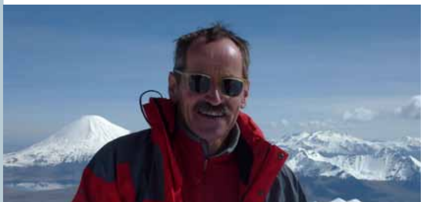
Pascal Aebischer Embajador de Suiza