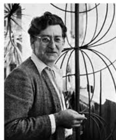
Roberto Burle Marx

La arquitectura del paisaje es un fenómeno que ha transformado completamente no solo el territorio, sino, sobre todo, nuestra manera de entenderlo. Sus inicios se sitúan en torno a 1800, y se desarrolla considerablemente durante el siglo XX; en la actualidad, y pese a su juventud, esta disciplina experimenta un auge espectacular que le otorga un papel de creciente importancia. El paisaje constituye, sin duda, una de las tendencias más significativas de nuestro tiempo. El arquitecto Paolo Bürgi presentará una exposición itinerante de la fundación suiza para la cultura Pro Helvetia sobre el trabajo y el impacto de los arquitectos del paisaje suizos.