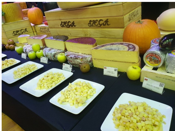
Schweizer Käsesorten / Svájci sajtajták / Foto: Robert Kattein

Am 19. Oktober fand in Budapest das zweite Internationale Käsefestival statt. Zehn Tonnen Käse – mehr als 400 Sorten aus über 25 Ländern – wurden im Rahmen der eintägigen Veranstaltung vorgestellt und verkostigt. Für jedes Land präsentierte der Organisator eine Auswahl an Käsesorten, die im Rahmen eines internationalen Käsewettbewerbs miteinander verglichen werden konnten.