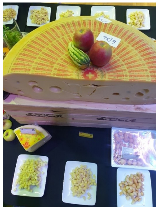
Der siegreiche Emmentaler/A díjnyertes ementáli

Svájci szemszögből nézve a nap nagyon sikeresen telt. Az ementáli AOP 2. helyezést ért el.