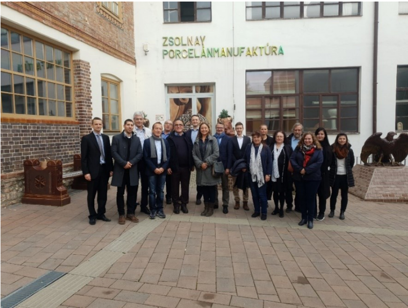
Die Schweizerische Botschaft und Swisscham bei Zsolnay / A svájci nagykövetség és a Swisscham a Zsolnay Porcelánmanufaktúrában / Foto: Zsolt Lénárt

Während sich die beiden grösseren Unternehmen im weitesten Sinne der Bauindustrie zuschreiben lassen können, sind die KMU in Branchen tätig, die unterschiedlicher nicht sein könnten: Unsere Landsleute sind beispielsweise im Weinanbau, in der Textilindustrie und auch im Metallbau engagiert.