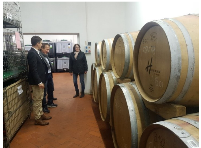
Besuch bei Winzerei Heumann / Látogatás a Heumann pincészetben / Foto: Robert Kattein

Der Besuch in Pécs bot der Delegation eine hervorragende Gelegenheit, um die verschiedensten Akteure vor Ort kennenzulernen sowie gleichzeitig einen Eindruck über die wirtschaftliche und politische Lage zu erhalten.