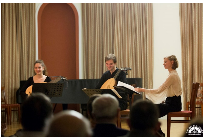
Trio Rosa Mundi