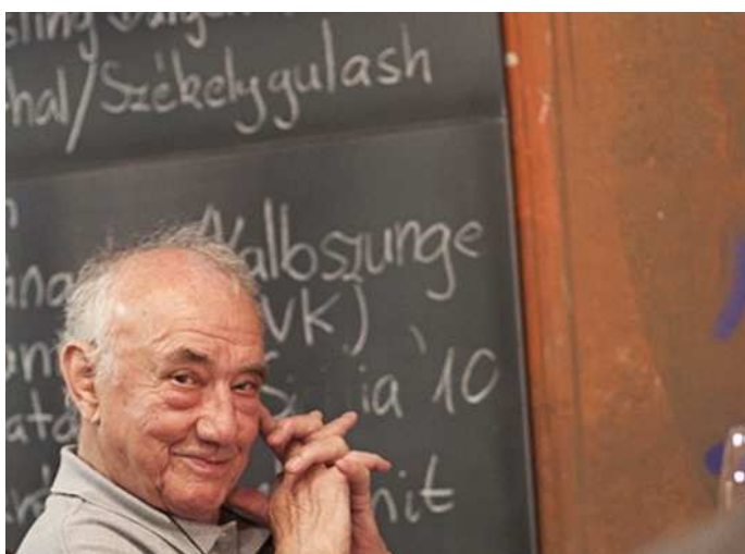
Daniel Spoerri während seines Budapest-Aufenthaltes im Restaurant Laci Konyha!