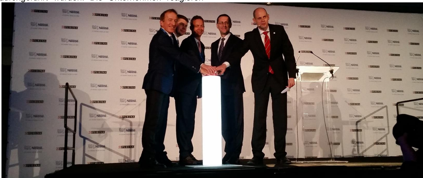
Eröffnung der modernisierten Tierfutterfabrik von Nestlé / A Nestlé modernizált állateledelgyár megnyitása

damit auch auf die erschwerte Situation am ungarischen Arbeitsmarkt. Diese Entwicklung hat zur Folge, dass die ungarischen Arbeitnehmer zunehmend an die Digitalisierung und Industrie 4.0 herangeführt werden und das Land somit Zugang zu diesen Technologien erhält. Es bleibt aber auch Aufgabe der Politik, die Ausbildung der Bürger dahingehend zu modernisieren, dass sie das Rüstzeug bekommen, von den technologischen Möglichkeiten Gebrauch zu machen.