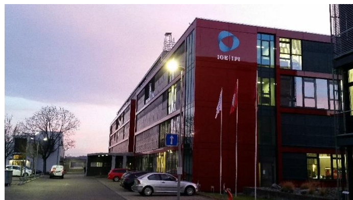
Institut für geistiges Eigentum in Bern / Szellemi tulajdon Intézet

die Kriterien bei verarbeiteten Lebensmitteln bzw. im Falle von industriellen Produkten nach gewissen Quoten bestimmt.