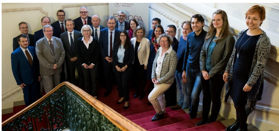
Die APK-N in der Andrassy Universität / A Svájci Nemzeti Tanács Külügyi Bizottsága az Andrassy Egyetemen