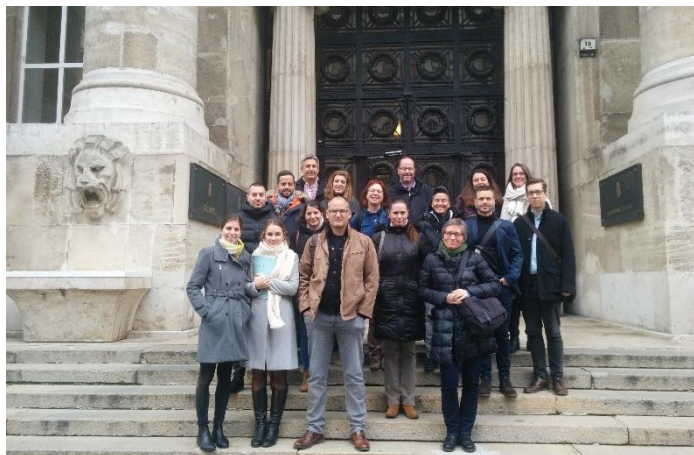
Die Schweizer Delegation mit einigen ungarischen Partnern vor der Generalstaatsanwaltschaft / A svájci delegáció néhány magyar partnerrel a magyar ügyészség előtt

„Swiss-Hungarian Transnational Cooperation on the Referral of Victims of Trafficking” - ez bonyolultan hangzik, mert az is.