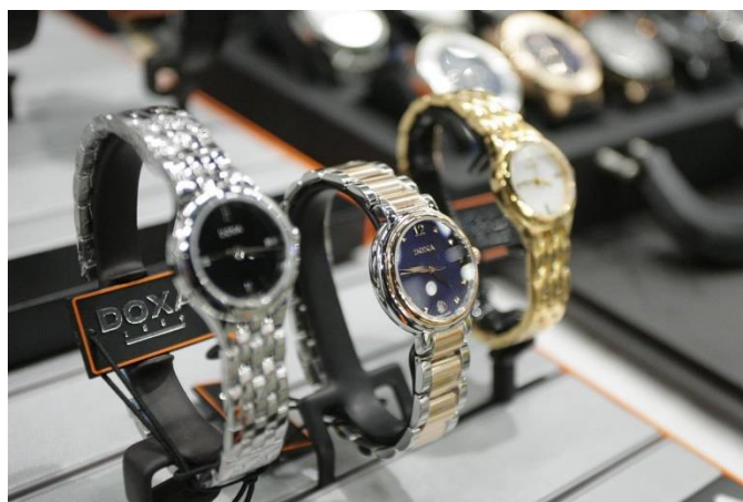
Schweizer Uhren / Svájci órák

A svájci kereszt és a svájci származásra vonatkozó jelzés használatának kritériumait szolgáltatásokra és termékekre is meghatározták. A szolgáltatásokra alapvetően érvényes, hogy egy vállalkozás csak akkor nevezheti svájcinak a szolgáltatásait, ha a