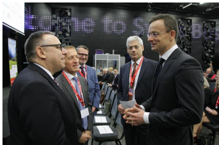
Von rechts nach links: Aussenminister Szijjártó, Swisscham Präsident Béres, Botschaftsrat Kocsis, Botschafter Burkhard, Stv. Staatssekretär Brühl / Jobbról balra: Külügyminiszter Szijjártó, Swisscham elnök Béres, Burkhart nagykövet úr, Kocsis követtanácsos úr, Brühl helyettes államtitkár úr

Im Rahmen der Messe zeigten sich 52 Aussteller mit ihren innovativen Produkten und boten zudem im Rahmen einer Jobbörse über 80 offene Stellen an. Die öffentliche Schweiz war durch einen imposanten