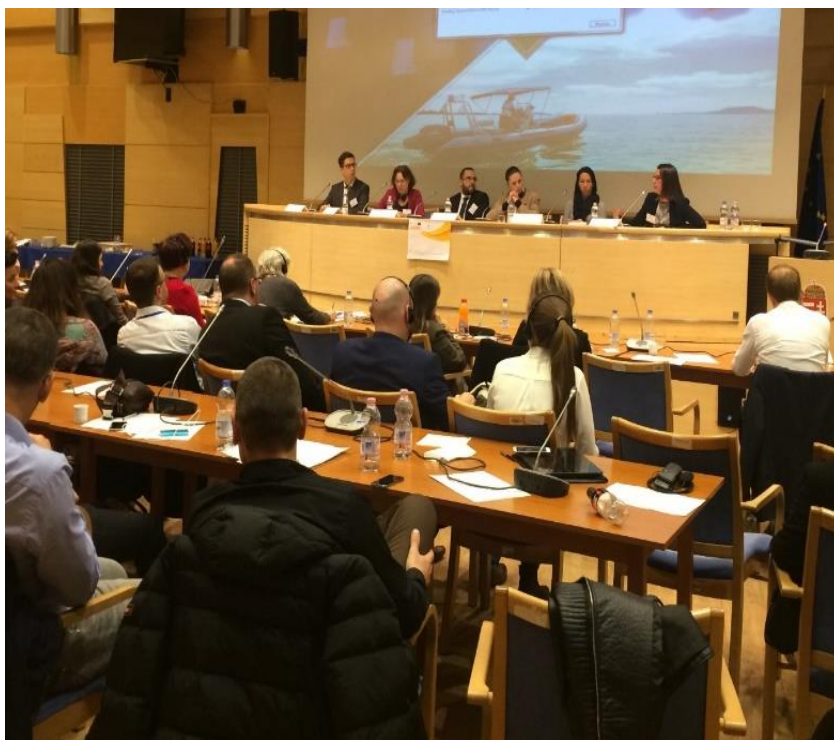
Abschlusskonferenz des Projektes im Hauptquartier der ungarischen Polizei / A projekt zárókonferenciája az ORFK központjában

Das Projekt, welches aus drei Dienstreisen bestand, hatte sich zum Ziel gesetzt, diese Zusammenarbeit