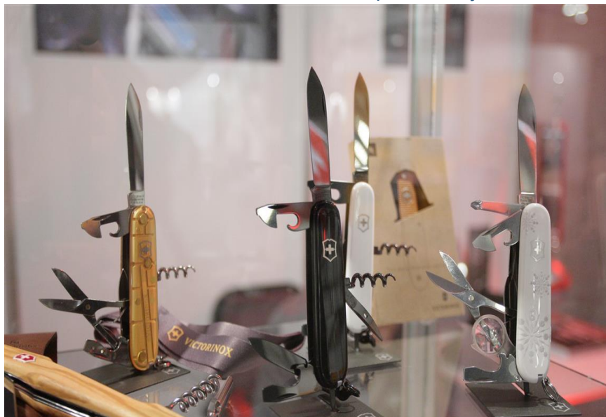
Victorinox Sackmesser / Victorinox bicskák

Ipari termékeknél az előállítási költségek legalább 60%-át Svájcban kell fizetni, és jelentős gyártási lépéseket is Svájcban kell megvalósítani. Ebbe a kategóriába sem tartoznak bele azok a természetes termékek, melyek nem lelhetőek fel megfelelő mennyiségben Svájcban.