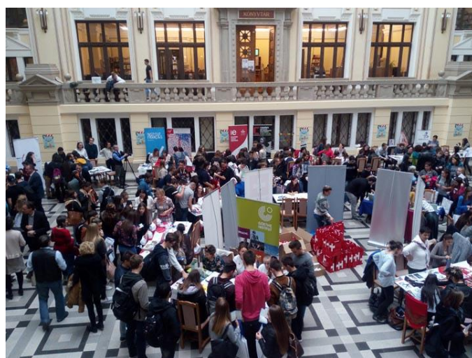
European Language Cocktail Bar 2017 / Az idei Európai Nyelvi Kocktélbár

Egy másik esemény is a Debreceni Egyetemhez vonzott több száz érdeklődőt, idén ugyanis itt került megrendezésre az Európai Nyelvi Kocktélbár is. Immár nyolcadik alkalommal került sor a Magyarországon működő európai kulturális intézetek és az Európai Bizottság az európai kultúrákról és nyelvekről szóló színes és szórakoztató eseményére. A kitűzött célt teljesítettük: felkeltettük sokak érdeklődését, és hangsúlyoztuk, mennyire fontos a nyelvtanulás.