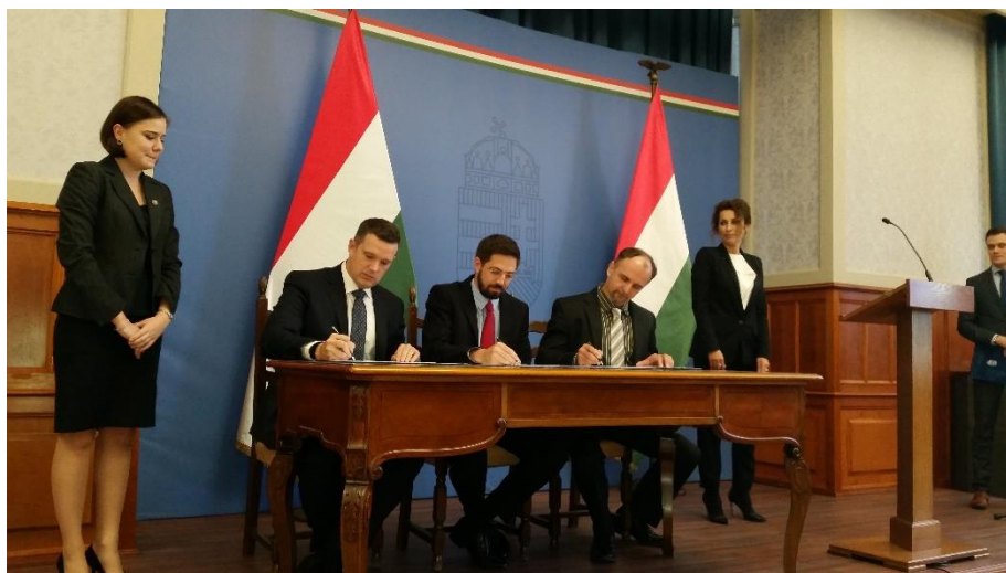
Kühne&Nagel: Die Unterzeichnung des strategischen Partnerschaftsabkommens / Kühne&Nagel: A stratégiai együttműködés aláírása

Az Adval Tech november 3-án nyitotta meg 5000 négyzetméteres termelési csarnokát. Ebben a csarnokban a svájci vállalkozás az autóiipar számára (többek között az Audinak és a BMW-nek) gyárt alkatrészeket. Az Adval Tech Csoport igazgatótanácsán és felügyelőbizottságán kívül a nagykövetség is képviseltette magát az ünnepségen.