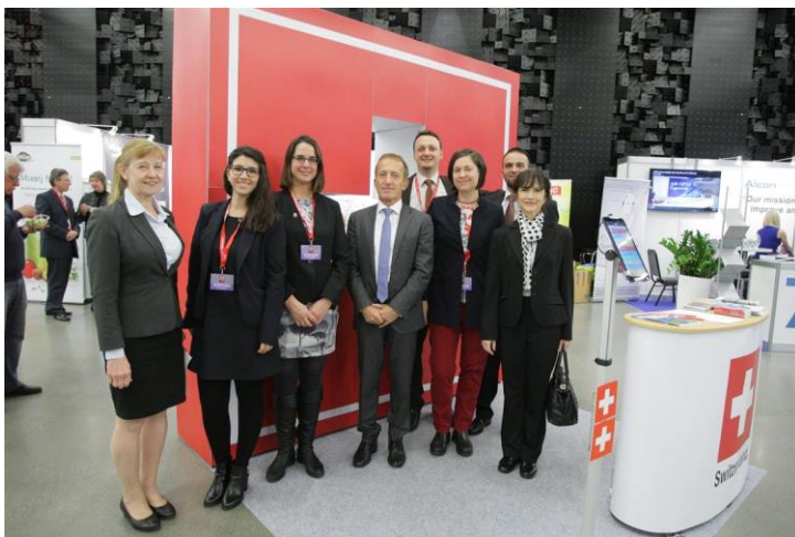
Ein Teil des Teams der Schweizer Botschaft am Swiss Business Day / A követség csapatának egy része a Swiss Business Day-en