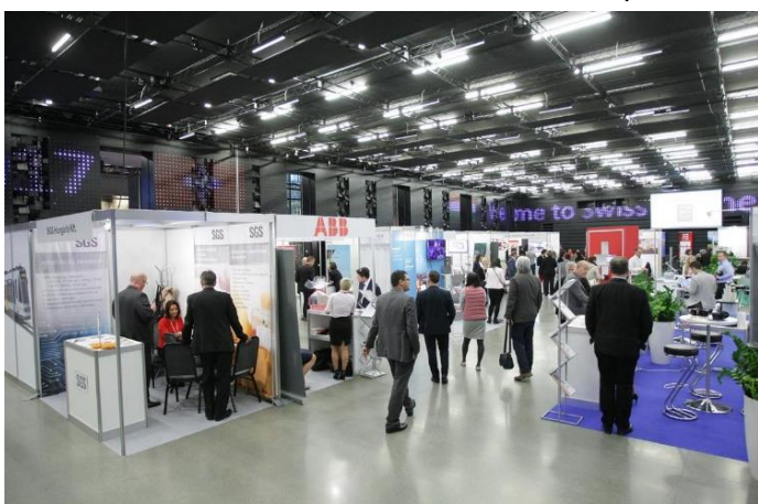
Der Swiss Business Day im Várkert Bazár / A Swiss Business Day a Várkert Bazárban

Zunächst diskutierten sieben Manager über die Anwendungsmöglichkeiten der neuesten Innovationen in ihren Unternehmen. Anschliessend erklärte der Generaldirektor des Wigner Forschungszentrums – welches die ungarische Partnerorganisation des schweizerischen CERN in Genf ist – inwiefern ein Privatunternehmen mit dem Institut gemeinsame Forschungsaktivitäten aufnehmen kann. Führende Juristen und Steuerberater diskutierten anschliessend steuerliche und rechtliche Aspekte, die bei Innovationen zu beachten sind.