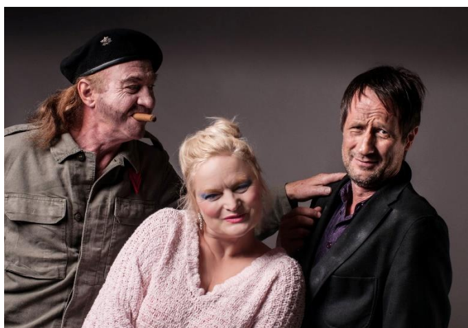
(c) Neue Bühne Budapest - Play Strindberg

Die Neue Bühne Budapest brachte ein Stück von Friedrich Dürrenmatt auf die Bühne, nämlich die bitterböse Komödie "Das Strindberg Spiel" (Play Strindberg). Das Theaterstück „Play Strindberg“ wurde 1969 in Basel uraufgeführt und war sofort ein Renner. Es handelt sich dabei um eine Überarbeitung des Dramas „Totentanz“ von August Strindberg. Das