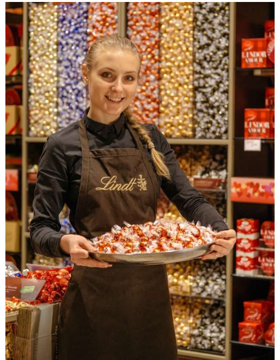
Lindt Boutique

Úgy a Jura, mint a Lindt&Sprüngli jó érzékről tettek tanúbizonyságot, mikor Roger Federert választották márkájuk nagykövetének. A két cég belépése Magyarországra jó hatással lehet a két ország közti kétoldalú gazdasági kapcsolatok további pozitív irányú fejlődésére. Federer a maga részéről már példát mutatott: a 2018-as évet ismét egy Grand Slam győzelemmel kezdte.