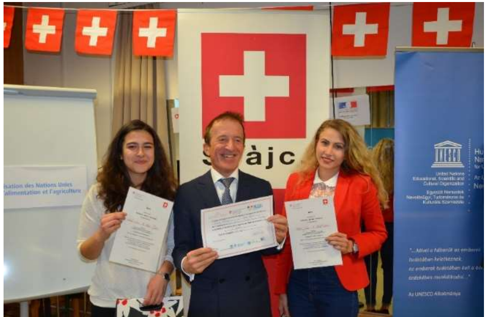
Cette équipe a gagné un voyage pour passer un week-end à Genève. / Ez a csapat nyerte a hétvégi genfi utazást.

L'après-midi, chaque équipe a présenté en tant que porte-parole du Bureau de Coordination des Affaires Humanitaires un plan d'action d'urgence humanitaire auprès d'un comité (dont l'Ambassadeur Suisse a fait partie) et ensuite une justification de ce plan auprès d'un comité d'experts onusiens. Finalement, l'équipe qui a offert la meilleure stratégie a gagné un voyage pour aller à Genève.