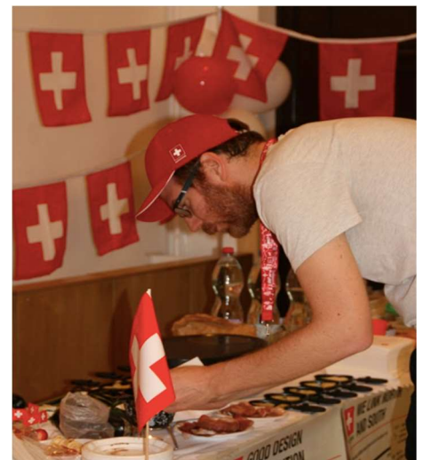
Svájci különlegességek az ISGS-en / Schweizer Spezialitäten an der ISGS

Egy további projekt keretében a követség a budapesti angol oktatási nyelvű BME International Secodary Grammar School (ISGS) érettségiző osztályát is támogatta, akik az idei „BME ISGS International Day” című vetélkedőn Svájcot választották témájuknak. Minden résztvevő osztálynak egy országot kellett kiválasztani. A Svájcot választó osztály azzal indokolta döntését, hogy hazánk a lehető legmultikulturálisabb ország. Az előadás középpontjában egy videóinterjú állt, melyet az osztály egy része készített a svájci nagykövettel. Része volt a prezentációnak egy interaktív „igaz-hamis”-játék a közönséggel, valamint a „We are the World” című szám francia, német, olasz és rétoromán nyelvű előadása. Egy asztalon svájci specialitásokat, például a raclettet és a fondüt mutatták be a követség által rendelkezésre bocsátott dekorációs anyagokkal – poszterekkel és zászlókkal – díszítve.