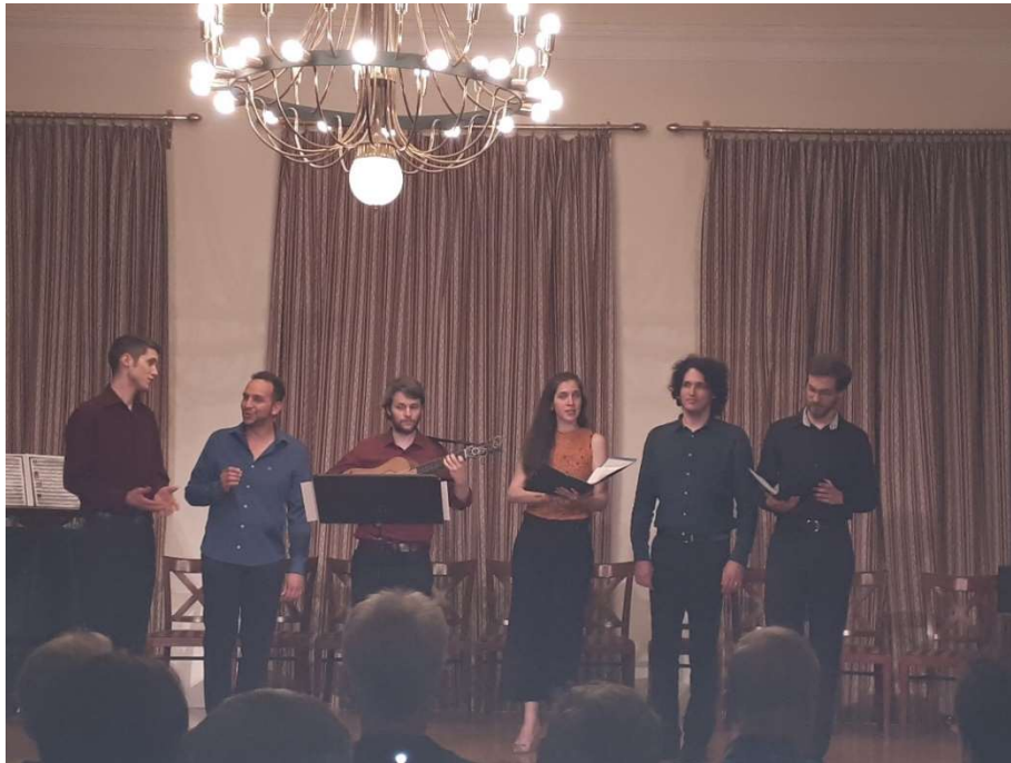
Auftritt des Vokalensembles Domus Artis im Óbudai Társaskör / A Domus Artis énekesegyüttes koncertje az Óbudai Társaskörben

Das Ensemble wurde 2017 in Basel gegründet, seine Gründungsmitglieder kommen aus Argentinien, Brasilien und Ungarn, und sind alle Studenten der weltberühmten Basler Musikakademie, der Schola Cantorum Basiliensis.