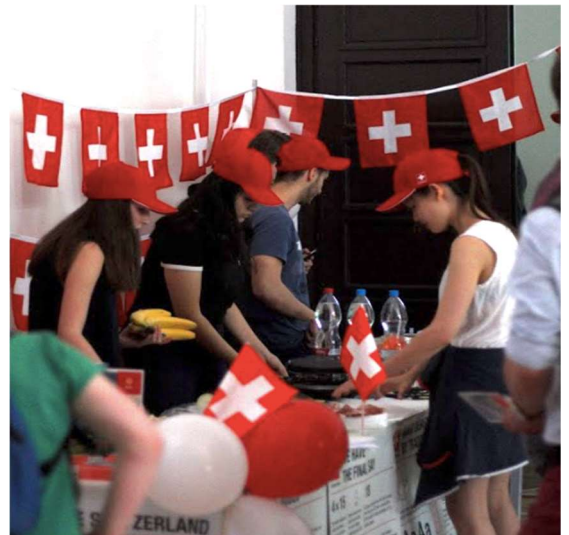
Schweizer Präsentationstisch im Rahmen des International Days an der ISGS / A svájci bemutatóasztal a nemzetközi napokon az ISGS-en

In einem weiteren Projekt unterstützte die Botschaft eine Maturandenklasse der englischsprachigen Budapester BME International Secondary Grammar School (ISGS) , die für ihre Präsentation am diesjährigen „BME ISGS' International Day“ die Schweiz auserkoren hatte. Jede teilnehmende Klasse hatte ein Land auszuwählen. Diejenige, die unser Land wählte, begründeten dies damit, dass es das multikulturellste sei, dass sie sich vorstellen könnten. Im Zentrum der Präsentation stand ein Video-Interview, das eine Abordnung der Klasse mit dem Schweizer Botschafter durchführte. Die Vorstellung umfasste auch ein interaktives „Richtig oder Falsch“- Publikums-Fragespiel, sowie einen Gesangsvortrag von „We are the World“ auf Französisch, Deutsch, Italienisch und Rätoromanisch. Auf einem Präsentationstisch stellte die Klasse schliesslich auch schweizerische Spezialitäten wie Raclette und Fondue vor, zu dem die Botschaft Dekorationsmaterial wie Poster und Flaggen beisteuerte.