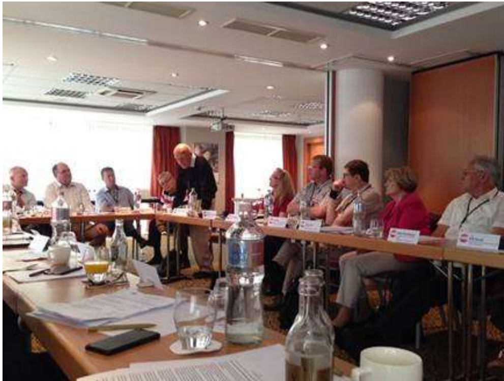
A bécsi konzuli körzet küldöttgyűlése Budapesten / Die Delegiertenversammlung des Konsularbezirks Wien in Budapest