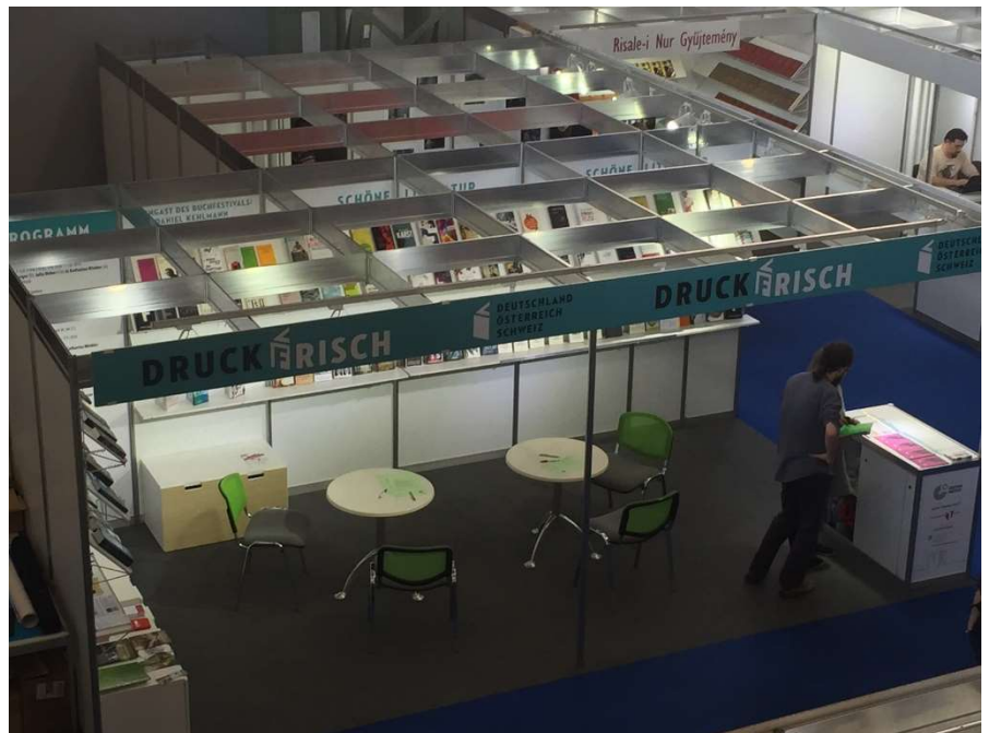
A Druckfrisch stand a 25. Budapesti Nemzetközi Könyvfesztiválon. / Der Stand Druckfrisch am 25. Internationalen Buchfestival Budapest.

Ezúton is szeretnénk köszönetet mondani a Pro Helvetia Kulturális Alapítványnak, hogy támogatták munkánkat és a könyvek Magyarországra küldését is vállalták.