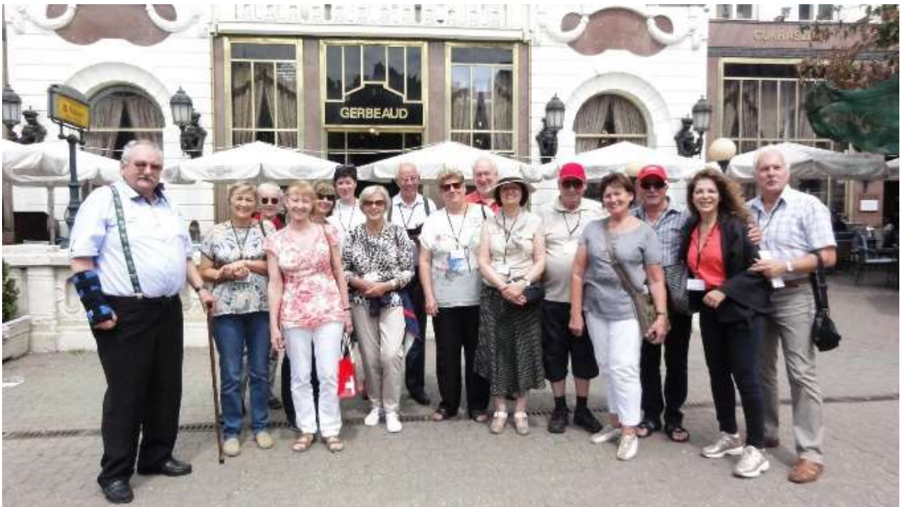
Begleitpersonen und Mitglieder des Schweizer Vereins Ungarn anlässlich der Delegiertenversammlung vor dem Café Gerbeaud / A küldöttgyűlés résztvevőinek kísérői és a Magyarországi Svájci Egyesület néhány tagja a Gerbeaud előtt