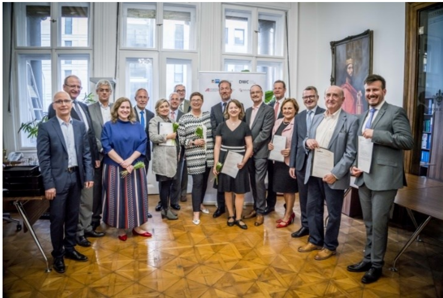
Vertreter der Gründungsmitglieder und Unterstützer von «Netzwerk Digital» / A Network Digital alapítóinak és támogatóinak képviselői

Anlässlich der Auftaktveranstaltung wiesen die Gründungsmitglieder auf die grundlegenden Veränderungen in Industrie und Gesellschaft hin, welche die Digitalisierung möglicherweise schon bald herbeiführen wird. Neben den Kommunikationskanälen zwischen Unternehmen, Behörden und Konsumenten wird diese auch interne Prozesse weitreichend umgestalten. Veränderungen in Produktion, Arbeitsmarkt und Verwaltung erfordern neue Kenntnisse und einen engen Erfahrungsaustausch in Bezug auf Best-Practice-Lösungen. «Netzwerk Digital» soll zur Stärkung der Wettbewerbsfähigkeit der Mitgliedsunternehmen beitragen und damit auch den Wirtschaftsstandort Ungarn stärken. Am 25. April unterzeichneten die Partnerorganisationen und Unterstützer ein Memorandum, welches die Zusammenarbeit innerhalb des Netzwerkes regelt.