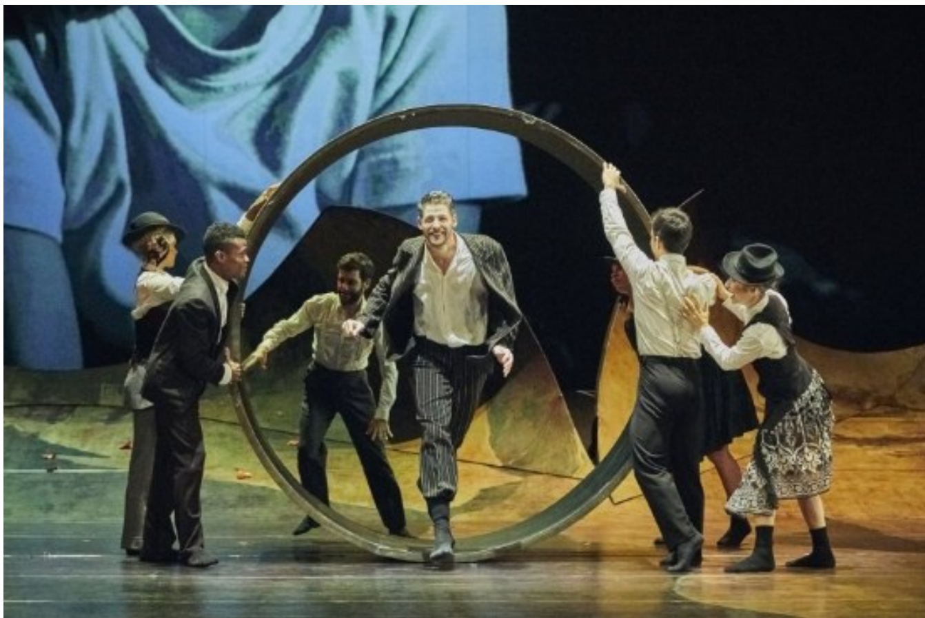
Szene aus der Vorführung / Jelenet az előadásból

Auf Einladung des Budapester Frühlingsfestivals trat das Ballett Theater Basel am 10. April im Erkel Theater in Budapest mit der Vorführung «Tevje» auf. Die Geschichte des Milchmanns Tevje erlangte durch das berühmte Musical «Der Fiedler auf dem Dach» weltweit Bekanntheit. Das Ballett Theater Basel führte das Stück im Herbst 2015 mit Motiven aus Scholem Alejchems Roman und mit der Musik des hervorragenden authentische Klezmer-Musik spielenden Schweizer Ensembles Kolsimcha auf. Das Ballett, welches das Leben der osteuropäischen Juden äusserst intensiv und faszinierend darstellt, wurde sowohl vom Publikum als auch von den Kritikern mit heller Begeisterung begrüsst. Das war in Budapest auch nicht anders, wo das Stück ebenfalls ein grosser Erfolg war.