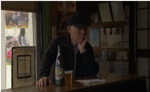
KAWASAKI KEIRIN | Regie: Sayaka Mizuno | 40 Min. | Schweiz, 2016

Im Wettbewerb des 1.ten internationalen Debütfilmfestival „Rudnik“ – 2 Schweizer Teilnehmer: