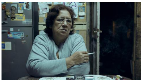
EN LA BOCA | Regie: Matteo Gariglio | 25 Min. | Schweiz, Argentinien, 2016

Jeden Tag werden die Männer zu einer winzigen Bar gezogen, wo sie ihre Zeit verbringen, um zu trinken, zu plaudern und auf die Rennen auf dem nahe gelegenen Radweg zu wetten. Diese Orte aus fast nichts erzählen Geschichten über fast alle.