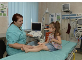
La DDC veille à ce que les enfants reçoivent les meilleurs soins médicaux possibles dans toutes les régions du pays.

des emplois plus nombreux et de meilleure qualité. Trois objectifs liés au marché du travail sont recherchés: