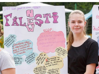
Une membre d'un groupe de jeunes participant au projet d'éducation civique présente fièrement leur vision en la matière et les activités prévues au sein de leur communauté, camp d'été, République de Moldova, 2019.