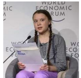
Die schwedische Klimaaktivistin Greta Thunberg auf einer Panelsitzung am WEF