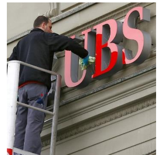
Milliardenschwere Busse für die UBS im Steuerstreit mit Frankreich (© The Economist, Grossbritannien)