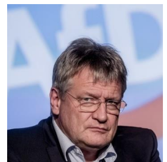
AfD-Parteichef Jörg Meuthen wegen dubioser Spenden aus der Schweiz unter Druck

Identität der Geldgeber, die hinter den Zuwendungen einer Schweizer Pharmafirma an die AfD stehen sollen. Anschliessend wird die Nachricht, wonach mehrere AfD-Politiker von der Schweizer Werbeagentur Goal AG nicht gesetzeskonforme Wahlkampfhilfen in Form von Dienstleistungen erhalten hätten, in den Fokus gerückt. Ferner findet auch ein von der Staatsanwaltschaft Zürich gutgeheissener Antrag auf Rechtshilfe mediale Beachtung. Obwohl sich die Aufmerksamkeit der Medien hauptsächlich auf die AfD-Vertreter und nicht primär auf die Schweiz richtet, hat das anhaltende Medieninteresse zur Folge, dass die Schweiz mit illegaler Wahlkampfhilfe und Geldern unklarer Herkunft in Verbindung gebracht wird.