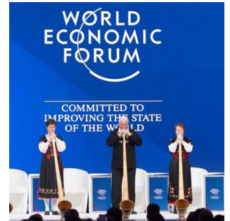
Alphornbläser an der WEF-Eröffnungszereemonie

Greta Thunberg finden dabei am meisten Aufmerksamkeit. Daneben berichtet die ausländische Presse über weitere anwesende Persönlichkeiten, aber auch über das Fernbleiben mehrerer bedeutender Staatschefs. Zum Teil gibt es auch kritischere Berichte, die