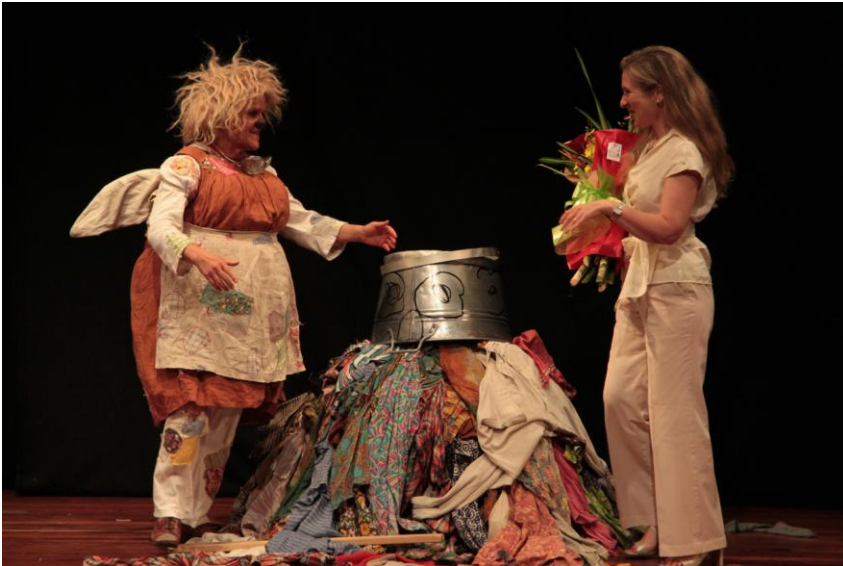
grosser Erfolg, schwere Blumen ...