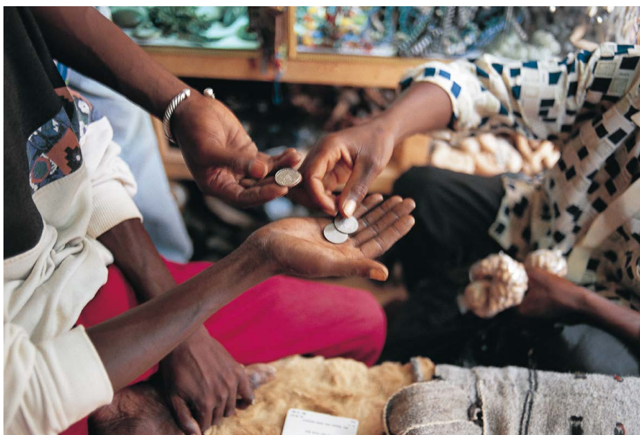
Geldwechsel in Mopti, Mali. Der gemeinsame Einsatz von DEZA und Krisenstab hat die wirtschaftliche Erholung und den sozioökonomischen Wiederaufbau der Region erleichtert.