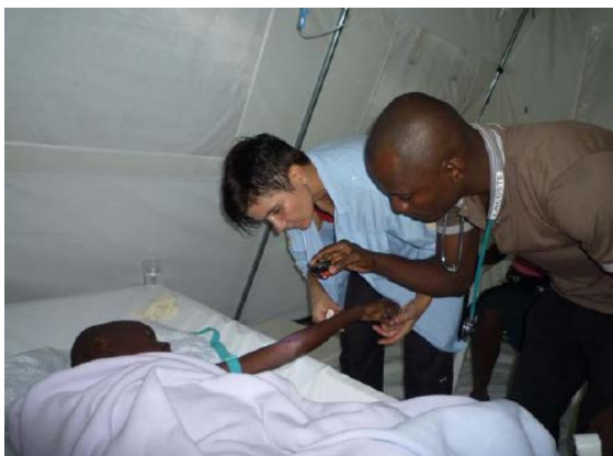
Traitement d'un malade du choléra