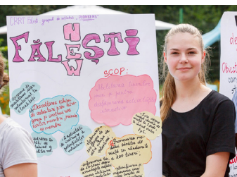
Une membre d'un groupe de jeunes participant au projet d'éducation civique présente fièrement leur vision en la matière et les activités prévues au sein de leur communauté, camp d'été, République de Moldova, 2019.