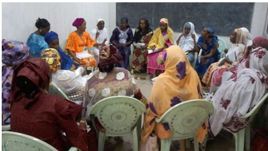
Atelier de femmes à l'occasion de l'assemblée générale de l'Association pour la Promotion de l'Élevage au Sahel et en Savane (APESS), une organisation soutenue par la DDC en Afrique de l'Ouest.