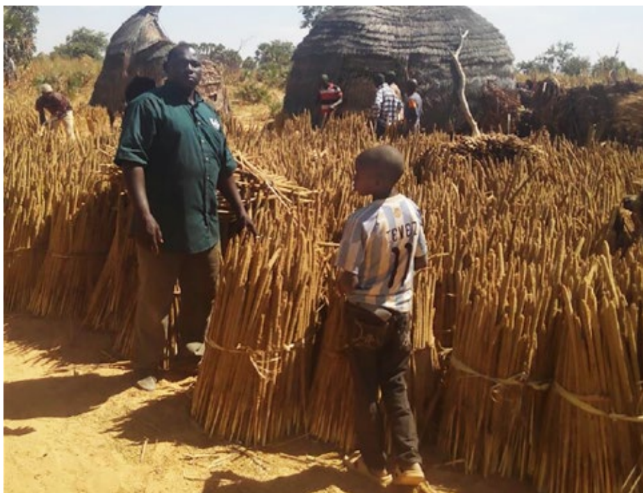
Le stockage d'une partie des récoltes dans des greniers, promu par les organisations paysannes, participe à la sécurité alimentaire. Ici du mil dans la commune de Falwel, au sud-ouest du Niger.

Actuellement, la Suisse en soutient directement plus de 500 aux niveaux local et national, et trois au niveau régional. «Dans un premier temps, nous les avons aidées à se mettre en place». Dès la fin des années 90, elles ont cherché à participer au dialogue social et au débat politique aux niveaux national et régional via des organisations faitières. Celles-ci, par leur plaidoyer, ont ainsi influencé les politiques agricoles dans ces pays. «Cette représentation, que nous avons accompagnée, a largement contribué à la défense de l'agriculture familiale et aux décisions régionales en matière d'investissement par exemple, souligne Pascal Rouamba. Ce travail en grande partie accompli, les organisations faitières donnent l'impression de stagner. Maintenant, il est nécessaire de soutenir plutôt des filières spécifiques comme le riz, le lait, l'élevage, ou des thèmes précis comme l'inclusion des jeunes et des femmes».