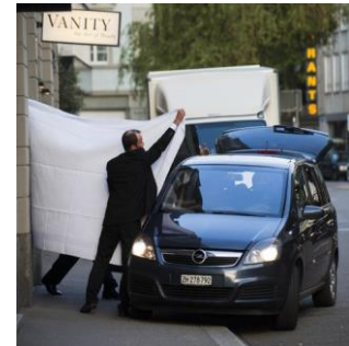
Fonctionnaires FIFA arrêtés à Zürich (© New York Times )

« Schweizer Bankgeheimnis: Das Spiel ist aus » ( Handelsblatt )