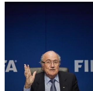
Sepp Blatter annonce sa démission