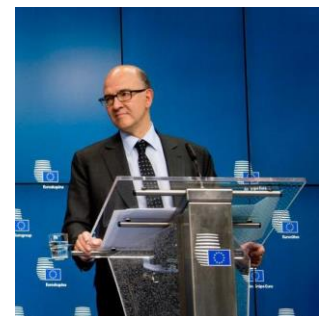
Pierre Moscovici lors de la signature de l'accord sur l'échange automatique de renseignements fiscaux