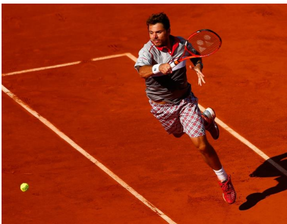
Stan Wawrinka, French Open Final 2015

La deuxième victoire de Stan Wawrinka en Tournoi du Grand Chelem à Roland-Garros rencontre un vif retentissement dans les médias étrangers. Avec des vedettes comme Martina Hingis, Roger Federer et désormais Stan Wawrinka, justement, la Suisse durant ces dernières décennies se serait transformée en véritable nation de tennis, ce qui d'après les médias se serait aussi manifesté lors de sa victoire de l'an passé en Coupe Davis. A côté de sa forte présence sur le court de tennis, la sphère médiatique célèbre les shorts particuliers portés par Wawrinka durant le tournoi. Ceux-ci seraient selon elle certes peu ordinaires d'un point de vue esthétique, mais reflèteraient l'auto-dérision sympathique du Suisse.