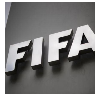
Ouverture procédure pénale