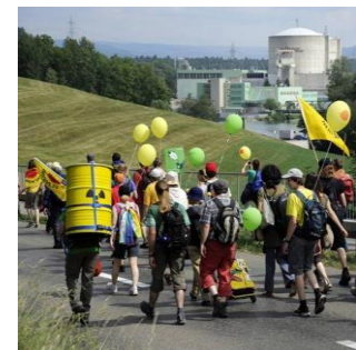
Participants à une manifestation anti-énergie nucléaire près de Beznau.