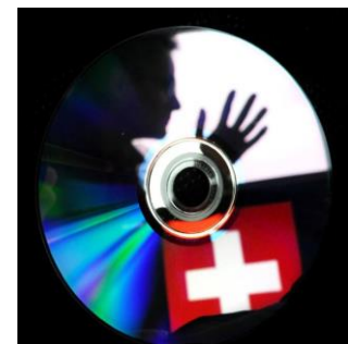
Espion suisse présumé arrêté à Francfort.