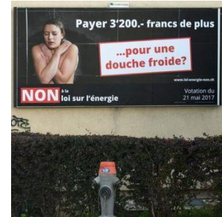
La campagne contre la nouvelle loi sur l'énergie (© BBC).

Les médias étrangers et en particulier allemands thématisent ce printemps les tensions entre la Suisse et l'Allemagne causées par l'arrestation d'un présumé espion suisse à Francfort. La presse allemande fait état de façon approfondie et critique du ressortissant suisse arrêté, qui aurait recueilli des informations sur les autorités allemandes de répression des fraudes fiscales pour le compte du Service de renseignements de la Confédération. Au-delà de la description des événements, différentes personnalités politiques allemandes sont citées, qui se sont exprimées de façon négative sur l'incident. La Suisse se trouve au centre de la critique médiatique en Allemagne. Il lui est reproché de réduire la lutte contre l'évasion fiscale à de belles paroles. L'affaire d'espionnage menace ainsi la crédibilité de la Suisse dans ses efforts pour l'introduction de l'échange automatique de renseignements et l'expose au reproche de vouloir défendre un intérêt national en matière d'argent au noir. Bien que la tonalité des comptes-rendus des médias allemands soit en majorité négative, il est avancé que les conséquences sur les bonnes relations entre la Suisse et l'Allemagne n'en sauraient être affectées qu'à cours terme. De rares commentaires témoignent par ailleurs d'une certaine compréhension pour l'action de la Suisse. Dans les médias internationaux, l'affaire sur les soupçons d'espionnage fait moins de bruit et la tonalité est plus neutre qu'en Allemagne.