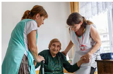
Les soins ambulatoires sont moins onéreux que les soins hospitaliers et déchargent les proches.

Le système de soins extra-hospitaliers mis en place avec succès en Bulgarie s'inspire du modèle suisse de soins à domicile, dont l'efficacité et la qualité ont été reconnues. Dans 4 communes du district de Vratsa, l'une des régions les plus pauvres d'Europe, la qualité de vie de 734 patients souffrant de maladies chroniques a pu être améliorée. Les membres de la minorité rom ont également été intégrés, aussi bien en tant que patients (15 %) qu'en tant que personnel soignant à domicile (25 %). L'objectif est d'étendre peu à peu le système des soins extra-hospitaliers à l'ensemble du pays. Le Parlement bulgare a déjà approuvé les changements législatifs qui ont permis d'introduire ces services médico-sociaux dans le système de santé publique. Une étroite collaboration entre les antennes suisse et bulgare de la Croix-Rouge a résulté du projet.