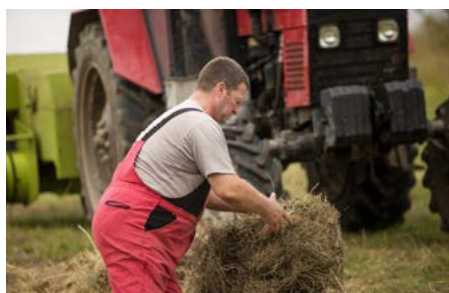
Des exploitations agricoles bulgares ont reçu des conseils pour une utilisation durable des ressources.

Au total, 45 ONG ont bénéficié de ressources financières provenant d'un fonds de soutien créé dans le but de promouvoir et de renforcer la participation de la société civile au développement économique et social du pays. Dans le cadre de projets relevant des domaines social et environnemental, les ONG bénéficiaires ont accru leurs capacités, mobilisé un certain soutien public en faveur de leurs causes et exercé une influence sur plusieurs réformes.