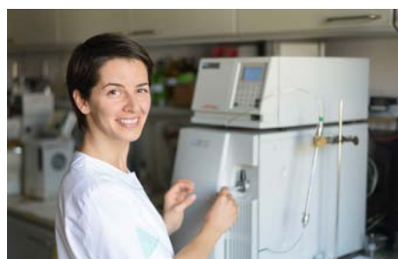
Les bourses de recherche ont permis de soutenir la carrière scientifique de jeunes chercheurs prometteurs.

Grâce à l'octroi d'une bourse, 22 doctorants et post-doctorants ont effectué un stage de recherche dans une université suisse. Dans le cadre d'un programme de recherche helvético-bulgare, 13 projets sont réalisés. Ces 2 programmes ont contribué à une meilleure intégration des chercheurs et des instituts de recherche bulgares dans les réseaux internationaux, ce dont témoignent plusieurs articles publiés dans des revues scientifiques prestigieuses.