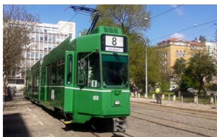
Les trams bâlois qui sillonnent la ville de Sofia offrent davantage de confort aux passagers, et leur plancher surbaissé facilite l'utilisation des transports publics aux personnes à mobilité réduite.

Une entreprise suisse a livré 28 anciens trams des transports publics bâlois (BVB) à Sofia. La Suisse contribue ainsi à l'amélioration du système de transports publics et, partant, à la réduction des embouteillages et de la pollution de l'air. Avec l'aide d'une entreprise spécialisée, la ville de Sofia a en outre développé un plan directeur pour une mobilité durable.