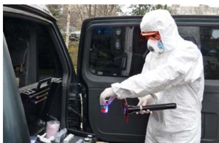
La mise à disposition de ressources techniques pour collecter des éléments de preuve améliore l'indépendance de la police criminelle bulgare.