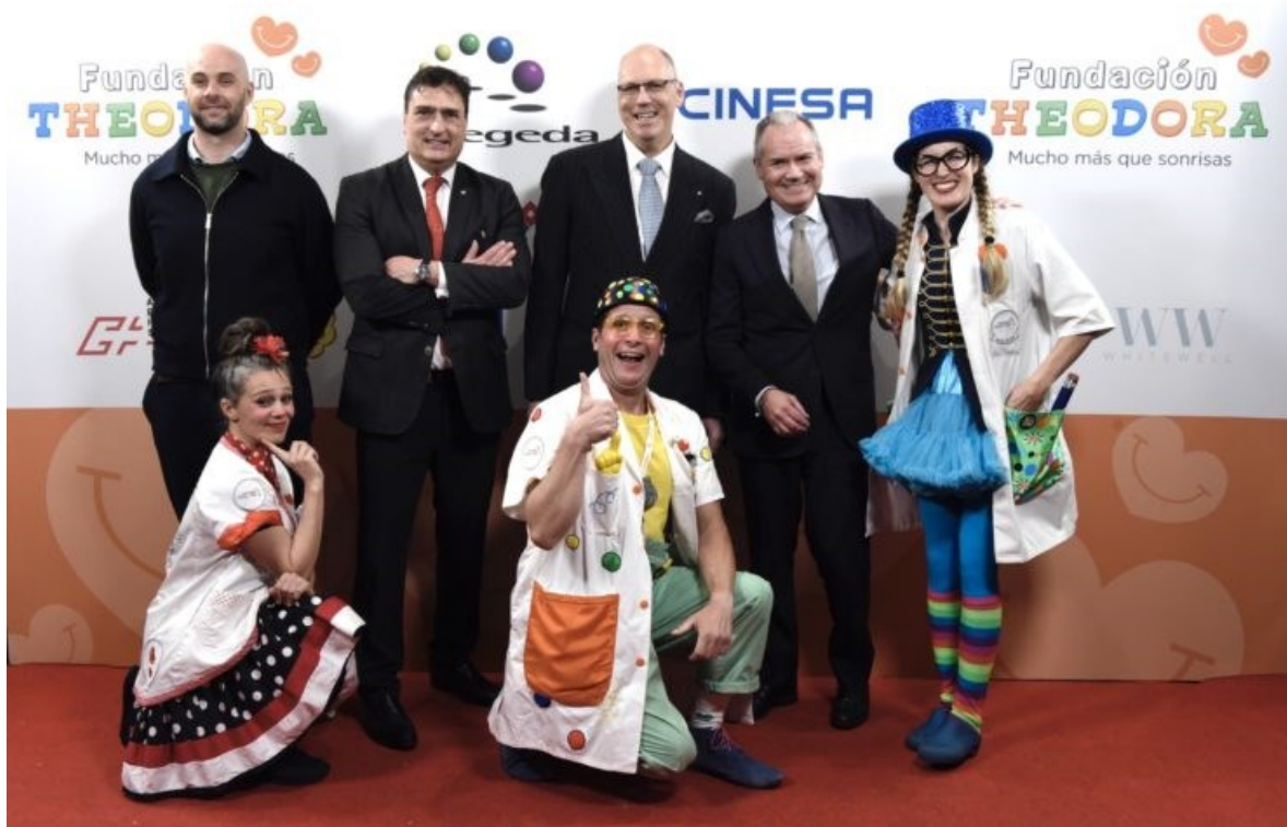
En el estreno del documental "Fundación Theodora: mucho más que sonrisas"

Si no puede leer correctamente este mensaje, descargue la versión en pdf