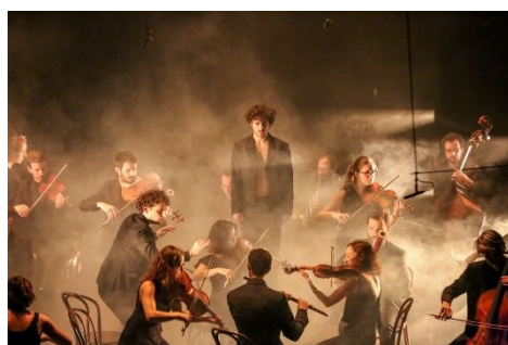
«Dance of the Sun», Geneva Camerata