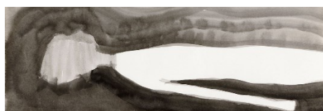
Exposición Silvia Bächli: Partitura