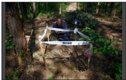
Au travers du projet de déminage en Croatie, la Suisse crée un environnement sûr et protégé pour la population vivant dans les régions infestées de mines.

Dans de nombreuses régions de Croatie, la vétusté du réseau d'approvisionnement en eau génère des taux de déperdition élevés. En outre, le pays doit combler un important retard en ce qui concerne la construction de systèmes d'épuration des eaux usées domestiques. De nombreux habitants évacuent aujourd'hui leurs eaux usées dans des fosses septiques. Il s'agit soit de fosses septiques en béton enfouies dans le sol, soit de simples fosses en terre qui sont régulièrement vidangées. Dans la région de Gorski Kotar, dans le nord-ouest de la Croatie, la Suisse soutient ainsi les communes de Delnice, de Fužine et de Brod Moravice dans la construction et la réhabilitation d'infrastructures d'eau potable et d'évacuation des eaux usées. Les travaux de construction, qui ont commencé en novembre 2018, sont réalisés de manière échelonnée.